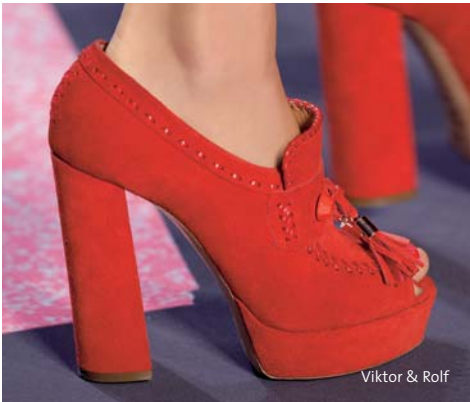
Viktor & Rolf

Des coloris intenses sont employés massivement et combinés – jaune soleil, pink, et orange, rouge laqué, bleu cobalt et rose font un effet expressif, clair et de renouveau. Les modèles de chaussures sont marqués par des formes volumineuses, des sandales sculpturales et des escarpins structurés qui se présentent sur de robustes talons cunéiformes. Des éléments sportifs tels des lanières et des bandes élastiques se chargent d'apporter des accents. Des plateaux de couleur donnent une nouvelle vie aux modèles classiques à lacets. Les effets brillants sont assurés en partie par des laques.